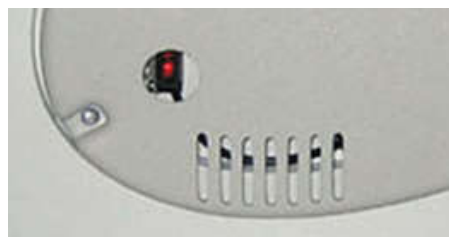
<センサー取付イメージ>